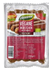
Seitanwürstchen Puszta-Art 3,29 € / 200 g