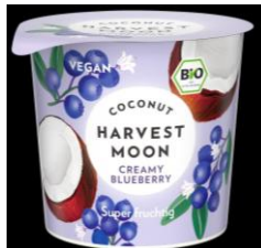
Coconut Creamy Blueberry, -vegan- 2,49 € / 275 g