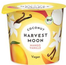
Coconut Mango Vanille -vegan- 2,49 € / 275 g