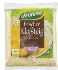
Frischer Klobsteig 3,99 € / 750 g